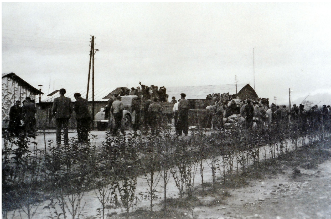
Bildunterschrift: Ein Foto aus der Ausstellung, aufgenommen im März 1941.

Saarlouis (red) Die Wanderausstellung "Gurs 1940" ist in den Herbstferien im Großen Sitzungssaal im Landratsamt Saarlouis zu sehen. Wie der Landkreis Saarlouis mitteilt, soll die Ausstellung dort in der Zeit von Montag, 18. Oktober, bis Freitag, 22. Oktober, Station machen, sofern die Pandemie-Lage es zulässt. Ursprünglich sollte die Wanderausstellung zum 80. Jahrestag der Deportation der Jüdinnen und Juden aus Südwestdeutschland eröffnet werden. Aufgrund der Corona-Pandemie musste sie verschoben werden. Die Ausstellung "Gurs 1940" erinnert an die Verbrechen an Jüdinnen und Juden aus Südwestdeutschland und an ihre Deportation. Unter den Verschleppten am 22. Oktober 1940 befanden sich auch 134 Menschen aus dem Saarland. Die Exponate beleuchten das Leben der Jüdinnen und Juden im Nationalsozialismus, betrachtet Täter und Täterinnen, Umstehende und Nutznießende in Deutschland und Frankreich und zeigt, wie dieser Verbrechen gedacht wurde und wird. Bundespräsident Frank-Walter Steinmeier hat die Schirmherrschaft über die Ausstellung übernommen, die auch vom Auswärtigen Amt unterstützt wird. Für die Erinnerungsarbeit im Saarland setzen sich das Bildungsministerium und die Landeszentrale für politische Bildung ein. Anschauen kann man sich die Ausstellungsstücke in deutscher und französischer Sprache. Die Ausstellung kann auch im Internet rein digital angesehen werden. www.gurs1940.de https://gurs.saarland